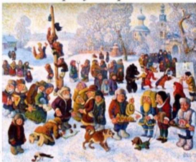
В. Сыров "Масленица"

В это день было больше всего развлечений. Начинался масленичный разгул. Устраивали конские бега, кулачные бои и борьбу. Строили снежный городок и брали его боем. Съезжали с гор на санях, лыжах. Катались на конях по деревне. Обычно кататься начинали в своей деревне, потом ехали в другие.