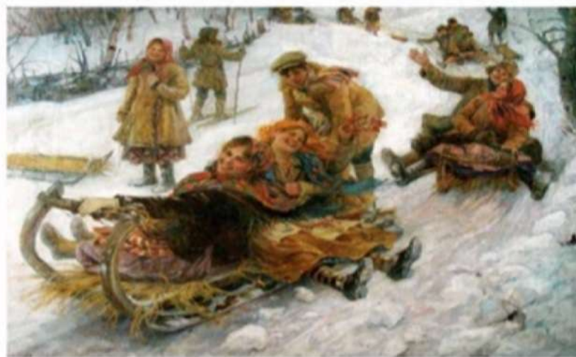
Ф.Сычков "Катание с гор"

Все ходили друг к другу в гости, пели песни. На заигрыш с утра приглашаются девицы и молодцы покататься на горах. Здесь можно было невесту найти, на суженого украдкой взглянуть. Но главное – как можно дальше прокатиться с горы, потому что катанье на масленицу не простое, а волшебное. Чем дальше прокатишься, тем длиннее вырастет лён в предстоящем году.